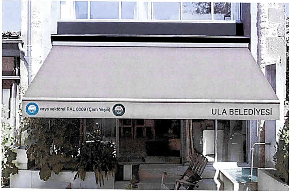
Şekil C. Örnek Tente Çalışması Krem (RAL 9001) - Tente üstü orijinal logo veya vektörel çam yeşili (RAL 6009) - tente yazısı çam yeşili (RAL 600)

Handwritten signatures and initials in blue ink.