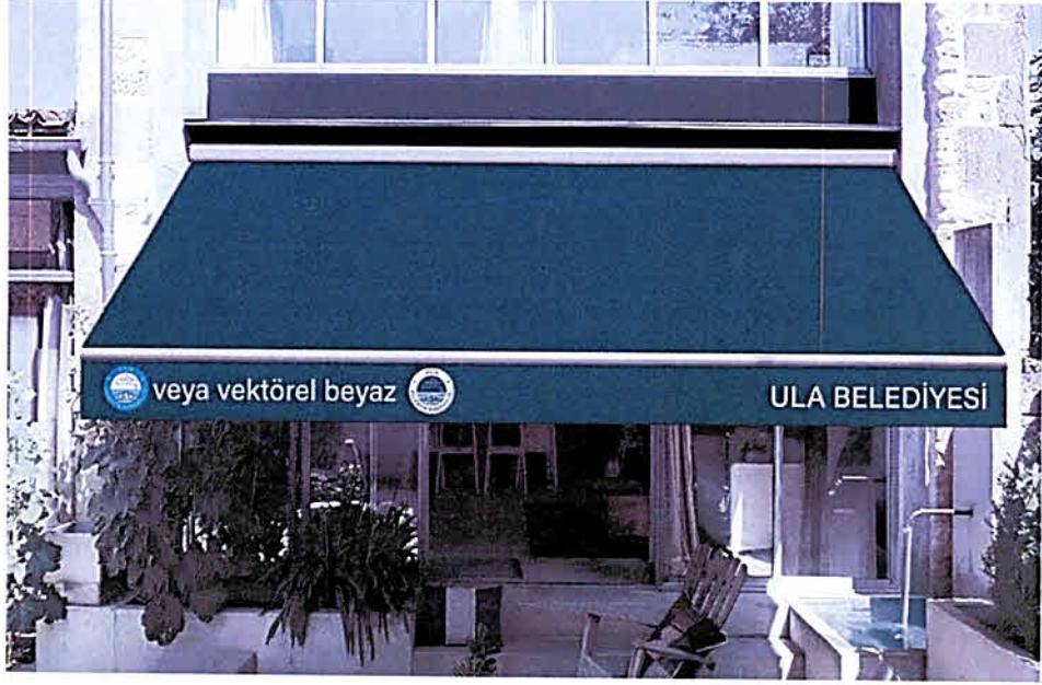
Şekil B. Örnek Tente Çalışması Çam Yeşili (RAL 6009) – Tente üstü orijinal logo veya beyaz vektörel logo, beyaz yazı

Tenteler yönetmelik Madde 4-(12)'ye uygun olarak yapı cephesi, rengi ve malzemesi ile uyumlu olarak tasarlanmalıdır. Tenteler tek yüzeyli olarak krem (RAL 9001) veya çam yeşili (RAL 6009) renkte tasarlanabilecektir. 3 tarafı kapalı Hollanda tarzı tenteler uygun değildir.