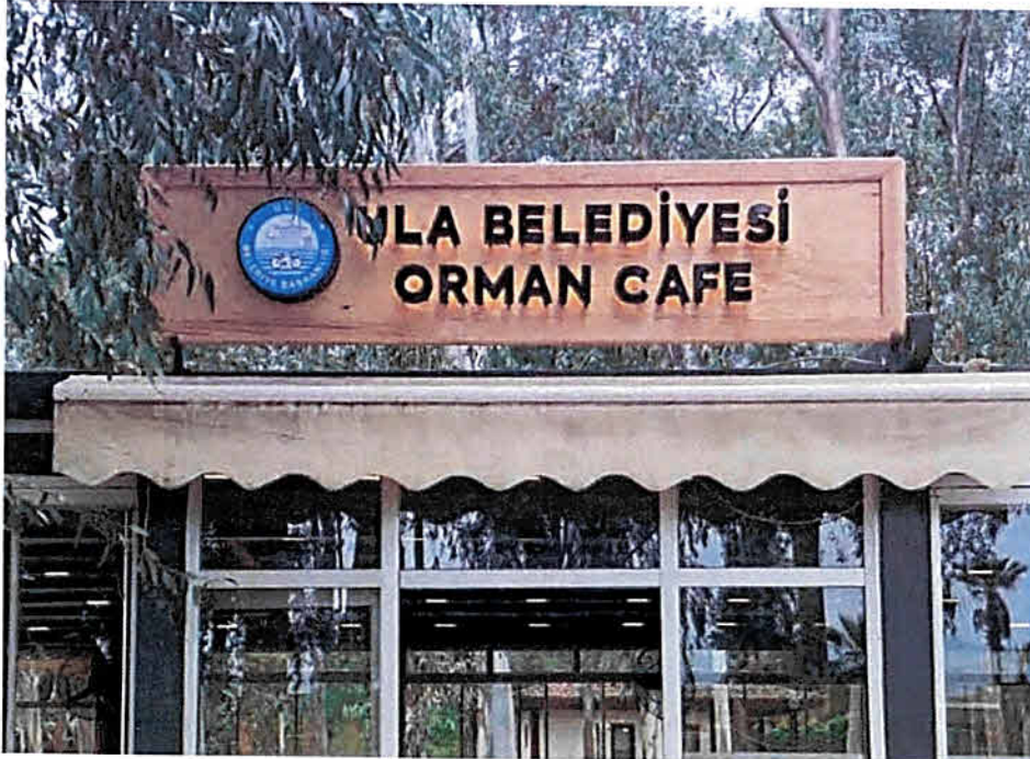
Şekil 1. Marin Su Kontrastı - Çerçeve Doğal meşe, kayın veya çam gibi açık tonlu ahşap üzerine Oksitli Krom Kutu Harf Örneği (Ledli)