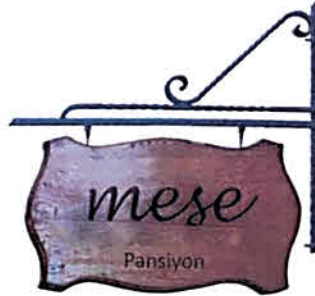
Ferforje askılı ahşap ya da corten levha

Cepheye dik olacak şekilde konumlandırılacak askılı konsol tanıtım tabelası yönetmelik Madde 4-(7)'de belirtildiği şekilde, izdüşümü kaldırımdan taşmamak koşuluyla, görsellerdeki alternatiflere uygun olarak en fazla 50x70cm boyutlarında ahşap ve ferforje malzeme kullanılarak hazırlanabilecektir.